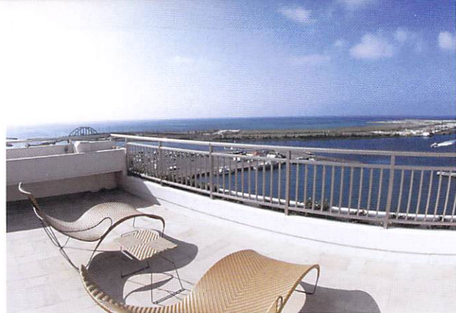
デラックスルーム・テラス