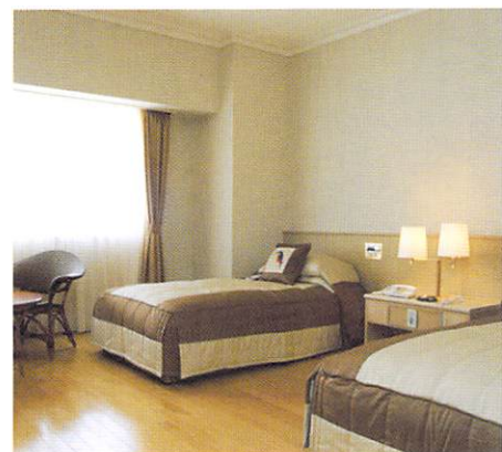
バリアフリールーム