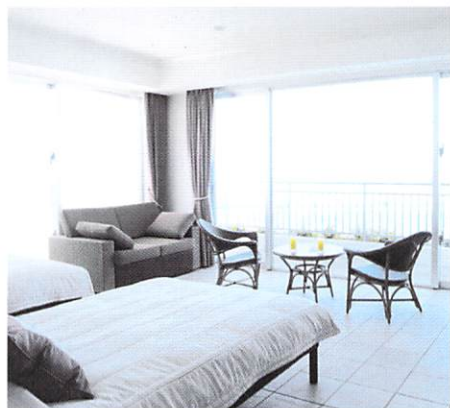
デラックスルーム