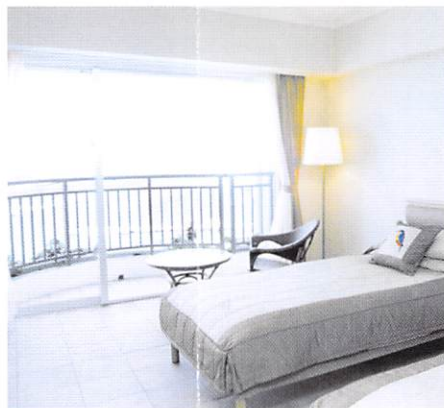
スタンダードツインルーム