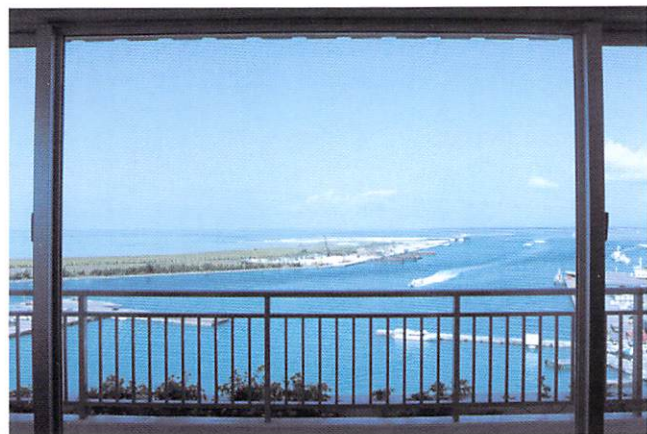
デラックスルーム・テラス