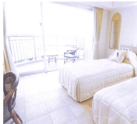
ジュニアツインルーム