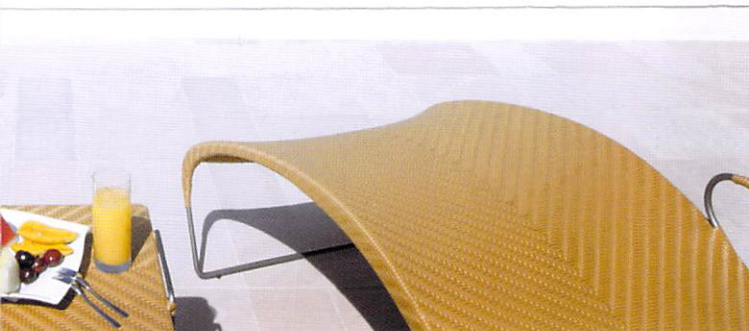
デラックスルーム・テラス